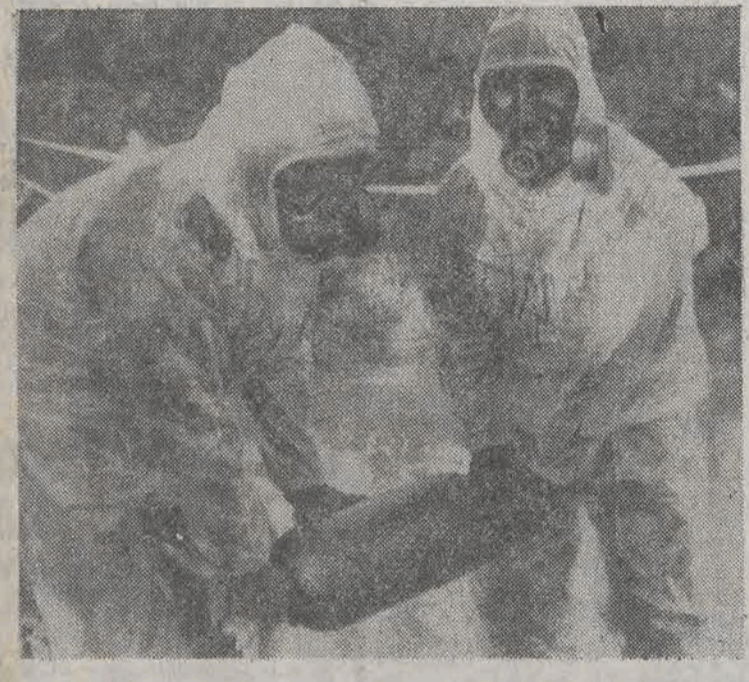
W. BRYTANIA. Sześć pojemników z iperytem (gazem musztardowym) z okresu I wojny światowej znaleziono podczas robót ziemnych w Basingstoke. N/z: żołnierze w specjalnych kombinacjach usuwają pojemniki ze śmiertelnie działającym gazem.

Pierwszy po dwuletniej przerwie samolot pasażerski „Aeroflotu” wystartował w czwartek z międzynarodowego lotniska Szeremietiewo do Teheranu. Regularne rejsy na trasie Moskwa — Teheran, wznowione z inicjatywą strony irańskiej, będą odbywały się raz w tygodniu. Na przebiegu trasy liczącej 3.100 km samolot „TU-154”, który może zabrać 160 pasażerów, potrzebuje 3 godzin i 50 minut.