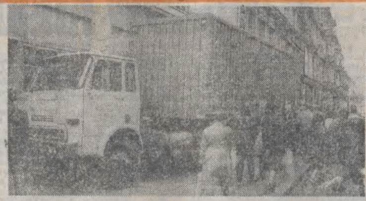
Widać wyraźnie, że kierowca ciężarówki nr rej. LDH 740B („Transmole” SBT Łódź) chciał koniecznie wjechać do sklepu, ale samochód okazał się chyba trochę za duży.