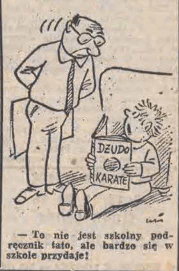
— To nie jest szkolny podręcznik faktu, ale bardzo się w szkole przydaje!