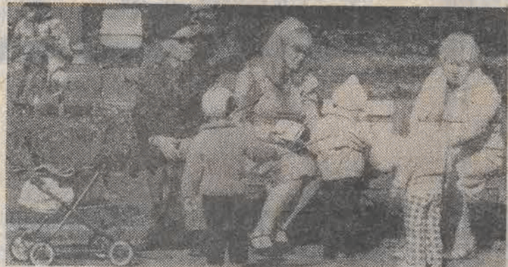
W jesiennym słońcu.