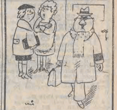
— Nie, nikt nie umarł, maż mi tylko w ten sposób przypomina, że dziś jest 20 rocznica naszego ślubu!