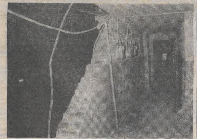
Tak wygląda korytarz II piętra oficyny, gdzie nastąpił wybuch.