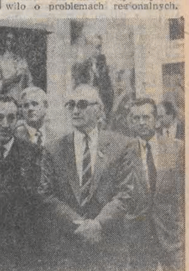
Delegacja PRL zwiedziła we wtorek reprezentacyjną wystawę dorobku artystycznego zatytułowaną „Kraj Rad”, która znajduje się w moskiewskim „Maneżu”.

Naszym zdaniem te stajnie Augustasza trzeba wpiwer zamieść do czysta, a dopiero potem powstawić wszystko na właściwych miejscach. Jeśli wybierzesz metodę odsuwania kupek brudu tyle tylko, żeby zrobić miejsce tam, gdzie nonsens wprost wola o pomście do nieba to daleko nie zajędziemy. A dokładniej mówiąc nie ru- szamy z miejsca. „DE”