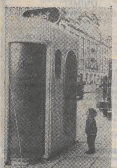
Na ulicach Amsterdamu zainstalowano nowoczesne toalety z automatyczną dezynfekcją promieniami ultrafioletowymi i oprzyjemniającą pobyt muzyką. Dla ewentualnych użytkowników — opłata wynosi pół guldena.

Ogłoszenie tej treści zamieścił londyński teatr „Hammersmith” przygotowujący przedstawienie musicalu „Lyle” w którym występuje autentyczny krokodyl w charakterze żywego rekwizytu.