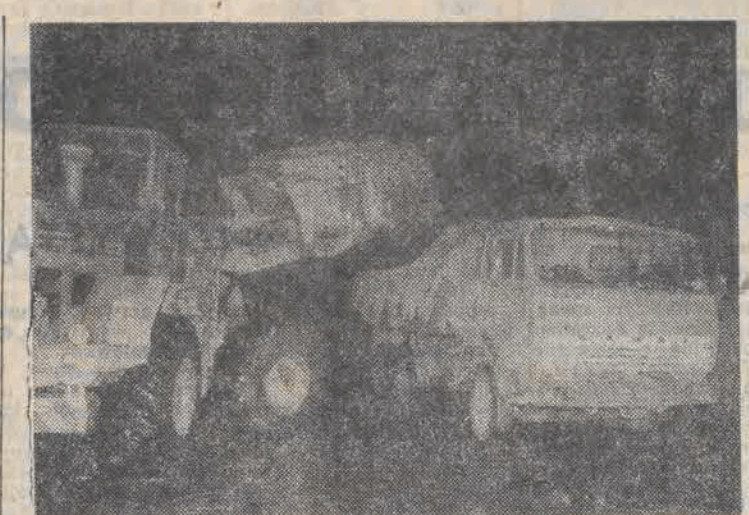
W rejonie Dworca Kaliskiego prace wro głównie w nocy. Każdej doby ciężarówka wywoza ponad 400 metrów sześciennych ziemi z nasypu starego wiaduktu. Do 20 grudnia połowa nasypu ma zostać rozebrana.