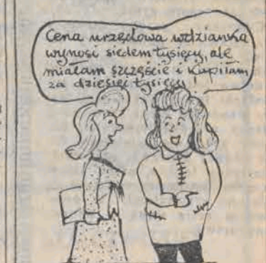
Rys. Adam Bienkowski

W drużynie Ajaxu przeciwko Porto wystąpił bracia bliźniacy. Kiedy ten drugi wchodził na boisko, sprawozdawca Szpaskowski poinformował że zawodnik ten ma — podobnie jak jego brat — również dwadzieścia jeden lat. I pomyśleć że w Holandii bliźniaczy rodza się w tym samym roku.