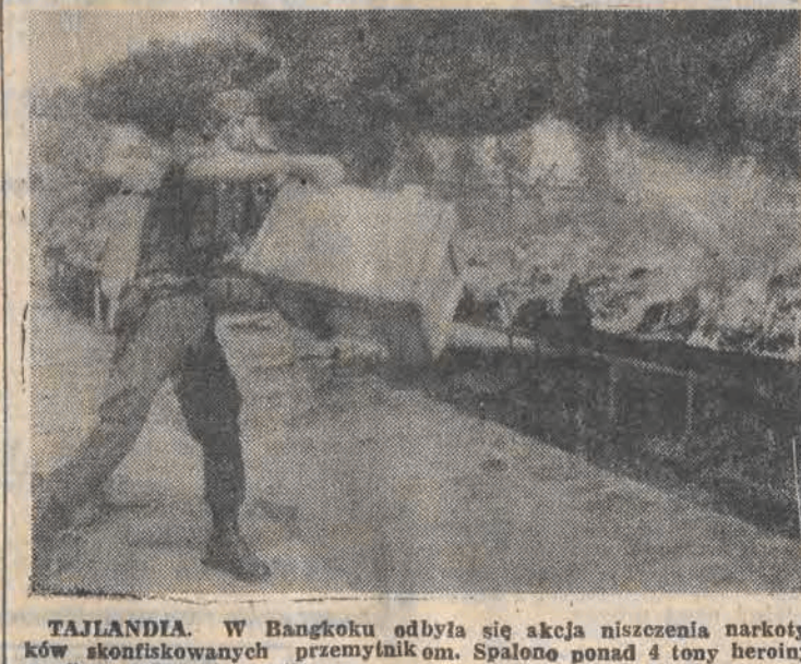
TAJLANDIA. W Bangkoku odbyła się akcja niszczenia narkotyków skonfiskowanych przemysłnikom. Spalone ponad 4 tony heroiny, morfiny, opium i marihuany.

Policja filipińska poinformowała w poniedziałek o tragedii jaka rozegrała się w kinie na przedmieściu Manili. Jeden z widzów w czasie wyświetlania horroru „Dla kawału” uruchomił przeciwpożarowy system alarmowy. Widzowie w popłochu rzucili się do wyjścia. Wiele osób stracono. Pod krzesłem znaleziono później zwłoki 13-letniej dziewczyny. Kilkadziesiąt osób zostało rannych. Korzystając z zamieszania „żartowniś” uciekł.