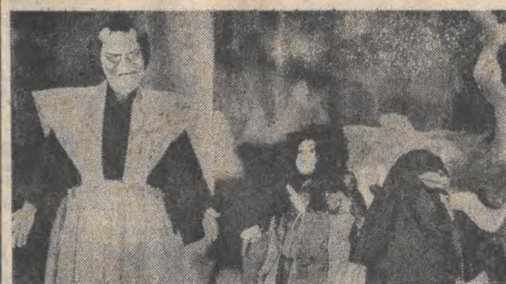
Na zdjęciu — scena ze „Śmieję się, śmieję mała Oshin”.