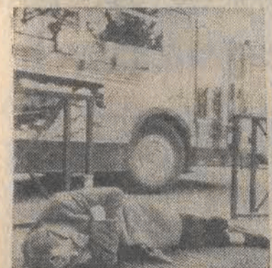
FRANCJA. Jeden z paryskich kiošków wykorzystuje ciepło z otworu wentylacyjnego metra w pierwszy mroźny poranek tej jesieni.

Dobiega końca program wspólnych prac 5 radzieckich kosmonautów na pokładzie orbitalnej stacji „Mir”. Dzisiaj Jurij Romanienko, Aleksandr Aleksandrow i Anatolij Lewczenko powracają na Ziemię. Pracę na orbicie kontynuować będą Władimir Titow i Musa Manarow. Rozpoczęto przygotowania statku „Sojuz TM-3” do opuszczenia orbity. Załoga przenosi do aparatu lądującego dokumentację przeprowadzonych doświadczeń, taśmy filmowe i magnetofony oraz inne materiały, a także zużyty sprzęt.