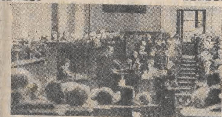
Nz.: podczas wystąpienia Bazylego Samojlika, ministra finansów.

W poświęcony poniedziałkowy poranek 28 grudnia nastąpił na Wiejskiej powrót do prozy życia, jaką są finanse. Chodziło o finanse państwa na przyszły rok. Temat był gorący, zwłaszcza że istnieje w nich deficyt sięgający 370 mld zł. Po referendum bowiem — oświadczył w Izbie strażnik państwowej kasy min. BAZYLI SAMOJLIK — powstała konieczność zmian w założeniach polityki cenowo-dochodowej, w wyniku czego wystąpiły poważne trudności w osiągnięciu równowagi w budżecie 1988 roku.