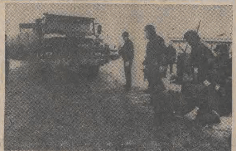
Policja szwedzka usuwa demonstrantów protestujących przeciwko rozładunkowi paliwa nuklearnego ze statku zachodniemieckiego dla elektrowni jądrowej w Vasteras.

Do Sejmu wpłynął 28 bm, przedstawiony przez Radę Państwa projekt nowelizacji ordynacji wyborczej do rad narodowych. Jak podkreśla się w uzasadnieniu — projekt ten stanowi kolejny krok w realizacji kompleksowego programu dalszych demokratycznych przemian w życiu społeczno-politycznym w Polsce. Celem zmian w ordynacji jest pobudzenie inicjatywy i zaangażowania mieszkańców miast i wsi w życiu publicznym w swoim miejscu zamieszkania, zwiększenie bezpośredniego udziału obywateli w kreowaniu przedstawicielskich organów władzy lokalnej. Ma to tym większą wagę, że lokalne organy władzy mają być niebawem wyposażone w realne instrumenty oddziaływania na poziom warunków życia mieszkańców.