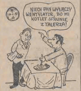
Rys. Adam Bieńkowski

Nadmiar wiedzy, a zwłaszcza nadmiar chęci podrywania się nią, doprowadza niekiedy do prawdziwego bełkotu. Oto na pewnej konferencji mówca używał takich określeń: ▲ struktura macierzysta; ▲ paradygmat społeczny; ▲ ostre profilowanie ideowe; ▲ instytucyjny dynamizm; ▲ autorytaryzm konsultacyjny; ▲ autorytaryzm perswazyjny; wielu podobnych. Doprawdy nie wiemy co prezydent miał na myśli, a tłumacza nie było.