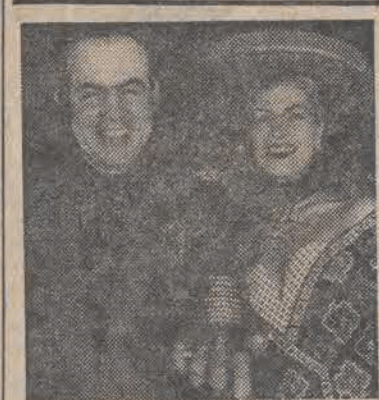
„Złoty Naparstek” — nagrodę za najlepszą kolekcję wiosenno-letnią otrzymał w Paryżu francuski projektant Christian Lacroix. N.z.: zdobywca trofeum i jedna z modelek prezentująca jego kolekcję.

Centrum czynne będzie od piątku, 29 stycznia, codziennie (nie wliczając dni wolnych od pracy) w godzinach od 8 do 22. Do rządowego centrum informacyjnego kierownictwo przedsiębiorstw może zwracać się telefonicznie lub telexem. Numery telefonów w Warszawie: 27-38-89, 28-78-70, 28-73-70 i 29-53-06. Numery telexów: 813446 URM pl oraz 812753 URM pl.