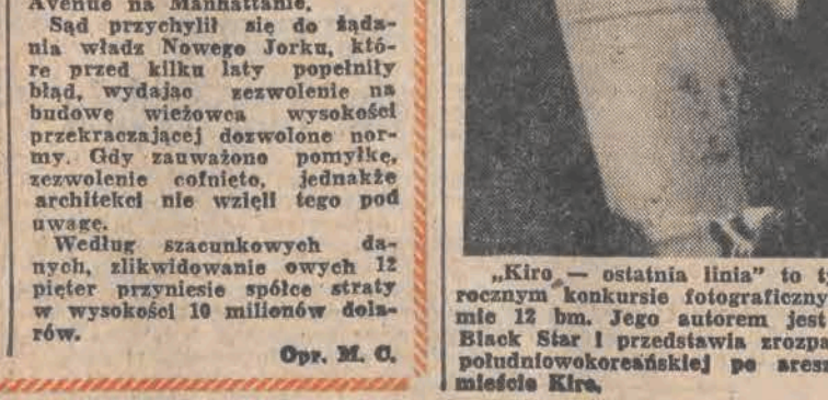
„Kiro — ostatnia linia” to tytuł Zdjęcia Roku wybranego na dorocznym konkursie fotograficznym World Press Photo w Amsterdamie 12 bm. Jego autorem jest fotoreporter amerykańskiej agencji Black Star i przedstawia zrozpaczoną matkę przed kordonem policyjnym postrzelonego w czasie wyborów w mieście Kiro.

Ożywiona polemika między władzami miejskimi Nowego Jorku, a spółką budowlaną Parkview Associates wywołana decyzją sądu, zgodnie z którą spółka została zobowiązana do „skrócenia” o 12 pięter 31-piętrowego drapacza chmur wybudowanego na eleganckiej Park Avenue na Manhattanie.