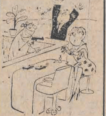
— Być może pan się spieszy, ale mnie nie wyszedł jeszcze lakier na paznokciach.