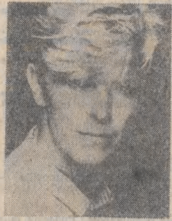
David Bowie wciąż należy do czołowych twórców muzyki roc- kowej. W wyświetlanym w na- szych kinach filmie „Labirynt” możemy podziwiać również jego talent aktorski.

To prawda, że Terence Trent D'Arby skromnością nie grzeszy. Czy jednak 25-letni multinstrumentalista i kompozytor, którego pierwszy longplay ozdrowiał miliony melomanów, musi udawać, iż jego suk- ces jest dziełem przypadku? Nagrał przecież spora porcję doskonałej muzyki. Właśnie rozpoczyna wielkie tournée w USA, obejmujące aż 40 miast.