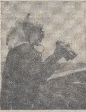
Marynara amerykański z okrętu USS Simpson obserwuje wody Zatokę Perską podczas konwojowania kujejskich tankowców.

Obchody organizowane również przez władze niektórych innych uczelni w kraju przebiegały w atmosferze