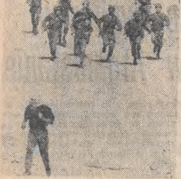
Okupowany zachodni brzeg Jordanu. Trwają represje izraelskie wobec Palestyńczyków, którzy demonstrują przeciwko okupowaniu terytoriów arabskich. Na zdjęciu: pogon izraelskich żołnierzy za uciekającym Palestyńczykiem.

Jak podała agencja KNA, podążając torowca najechał na furgonkę przewożącą robotników.