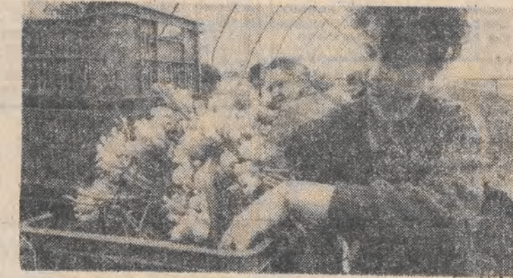
SURÓWKA Z CEBULI

Najbardziej dostępne, bogate w witaminy są: cebula i por.