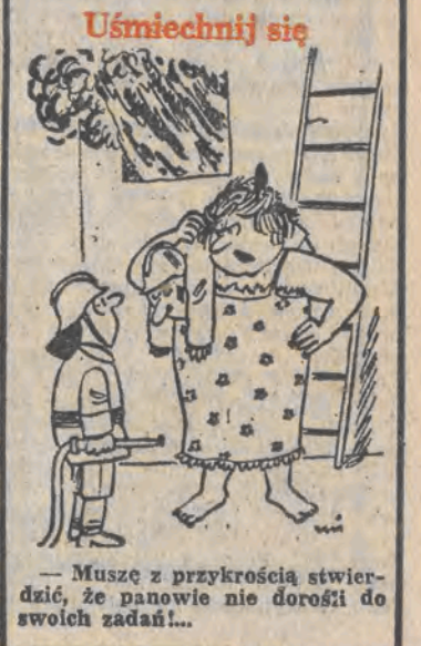
Muszę z przykrością stwierdzić, że panowie nie doróśli do swoich zadań...