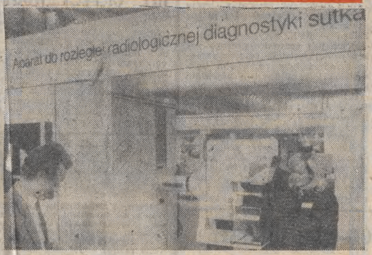
14 km. rozpoczął się w Poznaniu międzynarodowy sezon handlowy. Otwarty został międzynarodowy salon medyczny „Salmed 88” oraz międzynarodowy salon maszyn włókienniczych, odzieżowych i obuwniczych „Intermasz 88”.

Najstarsi ludzie nie pamiętają, by już w kwietniu chmary komarów były tak dokuczliwe. Tak jest w tym roku w Szczecinie i na peryferiach miasta. Zakład Dezynsekcji, Dezynsekcji i Deratyzacji już rozpoczął walkę z tą plagą na szczecińskich miejskich kąpieliskach w Dziwnowie i plaży mieleńskiej, by te miejsca masowej rekreacji ochronić przed zmozą komarów w sezonie.