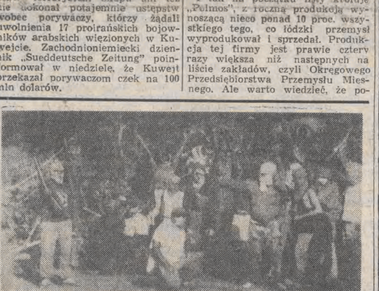
W Nowej Kaledonii — zamorskim terytorium Francji od kilku dni trwa ostry konflikt między rdzenną ludnością — Kanakami, a francuską żandarmerią.

25 bm. w Bydgoszczy i Inowrocławiu nie funkcjonowała komunikacja miejska. Przerwały pracę za-