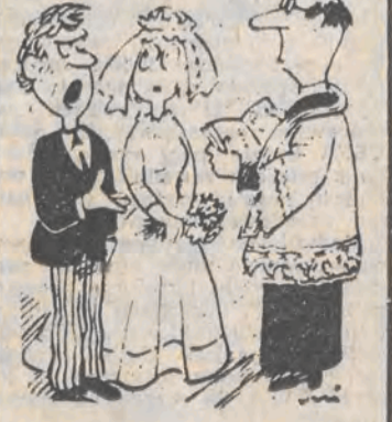
— Oczywiście, że ona CHCE! Przecież to był jej pomysł!

Agencja zachodnie poinformowała, że policja szwajcarska kantonu Zug zlikwidowała bandę składającą się z sześciu mężczyzn, którzy w ubiorach Ku-Klux-Klanu dokonywali napadów zbrojnych pa obozy dla uchodźców. Z przekazanych informacji wynika, że banda szwajcarskiego Ku-Klux-Klanu dokonała w minionym roku dwóch napadów na obozy dla uchodźców, znajdujące się w kantonach Zug i Uri. Ostrzelali oni mieszkańców obozów z broni śrutowej. Podczas jednej z takich napadów spalił przyniesiony z sobą krzyż.