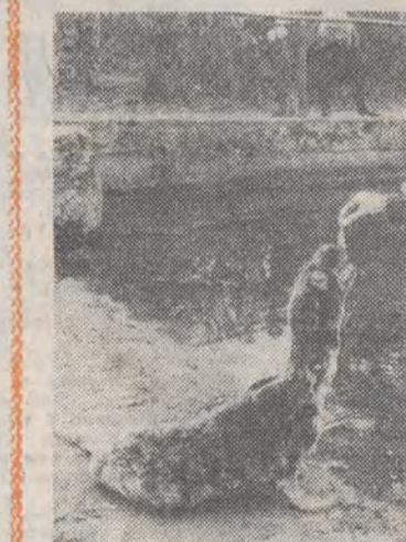
Male co nieco dla foczki.

KURY PRZECIWKO STRESOM Z publikacji ekspertów z Ministerstwa Rolnictwa Republiki Federalnej Niemiec wynika, że hodowla kur, gęsi i indyków ma znaczenie nie tylko gospodarcze, ale i społeczne. Badania wykazały bowiem, iż przebywanie w otoczeniu ptactwa domowego znakomicie wpływa na samopoczucie człowieka, a przede wszystkim na jego system nerwowy. Informację tę podano na wystawie ptactwa domowego w Stuttgarcie.