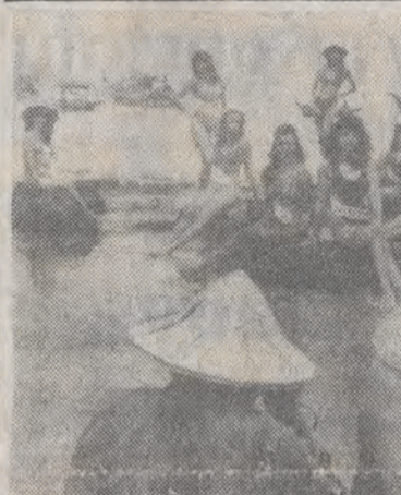
24 bm. w Taipei na Tajwanie odbędą się wybory Miss Uniwersum. Na razie zgromadzone tam dziewczyny opalają się na plaży ku radości miejscowych rybaków.

nego poszerzenia współpracy państwa i Kościoła. Osoby prowokujące strajki twierdzą, że chcą więcej demokracji ale prowadzą do skutków odwrotnych. Tworzenie napięć, strajki mogą tylko zahamować procesy demokratyzacyjne i reformatorskie. (Dalszy ciąg na str. 3)