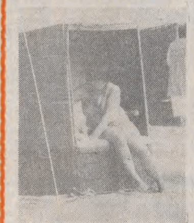
Na takie opalenie się musimy jeszcze trochę poczekać.