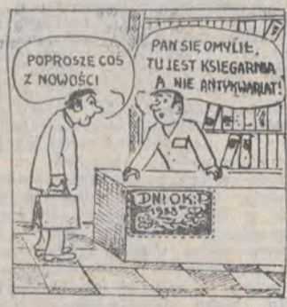
Rys. ADAM BIENKOWSKI

Niektórzy rodzice skarżą się że modele czołgów do sklepania (które było śmiesznie — niebieskie), produkowane przez Sniłdziejnie „Sniłdziej”, sprzedawane są (za 1800 zł) — bez „leju”.