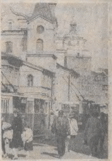
Fotoreportaż z Krakowskiego Przedmieścia zamieszczamy na str. 6.