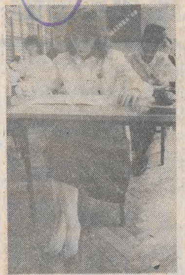
Zakończył się pisemny etap zmagani maturacyjnych. Wzorem rozwiązano zadania z matematyki.