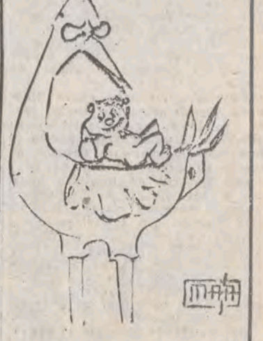
— Chyba cię zaniosę w niedzielę.