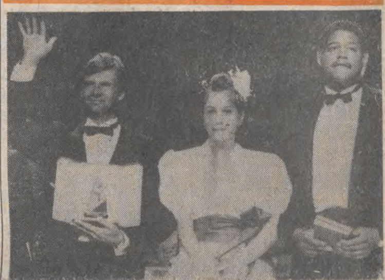
Laureaci 41 Międzynarodowego Festiwalu Filmowego w Cannes: od lewej: Billy August, reżyser duński, zdobywca Złotej Palmy za „Pellego Zwycięzcę” 13-letnia Brytyjka Johal May, zdobywczyni jednej z 3 nagród za najlepszą rolę kobiecą w filmie „A world apart” (Osobny świat) oraz aktor amerykański Forest Whiteaker (najlepsza rola męska, w filmie „Bird”).