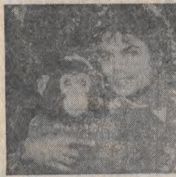
Michael Jackson z przyjacielem.