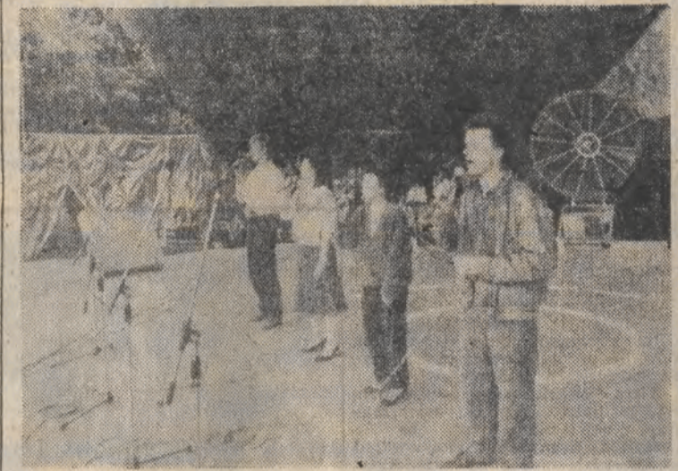
Na XXIV Festiwalu Piosenki Radzieckiej w Zielonej Górze rozpoczęła się 7. rywalizacja o złoty, srebrny i brązowy samowrót. Przed publicznością w amfiteatrze wystąpiło po raz pierwszy 25 solistów i 9 zespołów, które wyloniono w ogólnokrajowych eliminacjach spośród 24 tys. piosenkarzy amatorów.

Nz.: zespół „Reling” z Uszki w czasie generalnej próby.