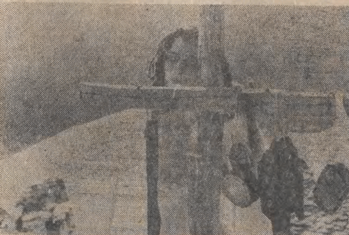
Kadr z filmu „Zmierzać, ale dokąd?”.