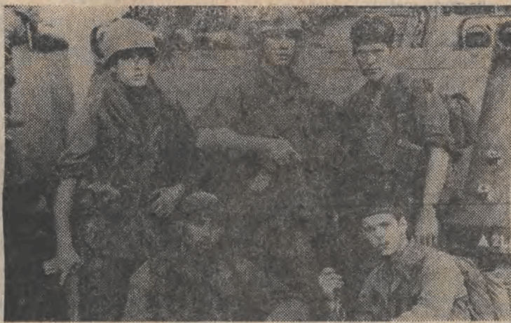
Kadr z filmu „Pluton”.

Dystrybutorzy chyba się nie mylą. Film Jacka Bromskiego „Zabij mnie, gliko”, to propozycja, która ściąganie tłumy. Jest to film rozrywkowy, mający wszystkie walory kina gangsterskiego. Na pytanie dlaczego film gangsterski, reżyser odpowiada tak: „Zamierzałem zrobić film według opery Beethovena „Fidelio”. Ale okazało się, że nikt nie chce mi dać pieniędzy na obraz, który nie znajduje szerokiej widowni. Postanowiłem więc zrobić film kasowy, żeby zarobić na niekomercyjny”.