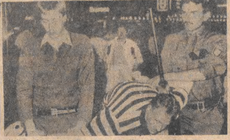
Policjanci po meczu Holandia — Anglia w Duesseldorfie kontynuowali likwidowanie prób wniepcenia bójek przez „pseudokibiców”.

Znany już pierwszy półfinał mistrzostw Europy w piłce nożnej. Zostali nimi reprezentacje RFN i Włoch z grupy I. Gospodarze „Euro 88” pokonali na stadionie w Monachium Hiszpanów 2:0 (1:0) zdobywając gole po celnych strzałach Voellera (30 i 51 min.). „Squadra Azzurra” wygrała z Danią również 2:0 (0:0). Bramki dla zwycięzców strzelił: Altobelli (66 min.) i de Agostini (88 min.). Pierwsze miejsce w grupie I zajęła reprezentacja RFN, która spotka się w półfinale z drugim zespołem grupy II, drugie natomiast Włochy i grać będą w półfinale z pierwszym zespołem grupy II. Dzień natomiast ostatnie mecze eliminacyjne w grupie II. Oba o godz. 15.30. Telewizja przeprowadzi transmisję z meczu Anglia — ZSRR o godz. 17.30 zaś ze spotkania Holandia — Irlandia o godz. 22.15 (obie w programie I i obie „z poślizgiem”).