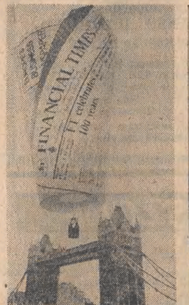
Lotem balonu w kształcie zwiniętej gazety uczczono w Londynie 100-lecie „Financial Times”. 30-metrowej wysokości balon został zbudowany przez Pera Lindstranda.

— Co więcej, poza chorobą Parkinsona rozważana jest możliwość leczenia, za pomocą transplantacji, innych chorób, np. otępienia przedstarczego. Ale kto raz widział osobę chora na parkinsonizm, kiedy nie może ona samodzielnie chodzić, jeść, pić, obsługiwać się i wykonywać żąd-