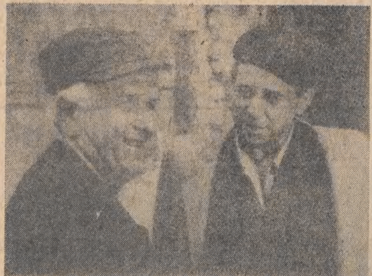
„Nie rozstajemy się z żadną postacią”.