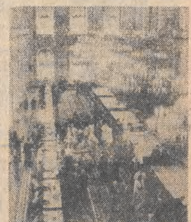
W Moskwie trwają przygotowania do 19 Konferencji KPZR. Na zdjęciu: rejestracja przybywających delegatów w Pałacu Kremleskim.

Celem wizyty jest zaznajomienie władz MBOiR z sytuacją ekonomiczną Polski oraz przemianami wynikającymi z reformy gospodarczej. Można się spodziewać, że w czasie rozmów strona polska podkreśli znaczenie normalizacji stosunków kredytowo-finansowych dla postępu reformy i przyspieszenia zmian strukturalnych w gospodarce. Delegacja zapozna się z projektami przedsięwzięć, które mogą być objęte finansowaniem przez Bank Światowy.