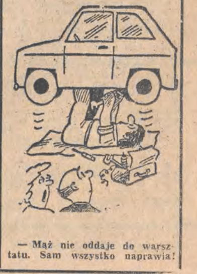
— Mąż nie oddaje do warsztatu. Sam wszystko naprawia!