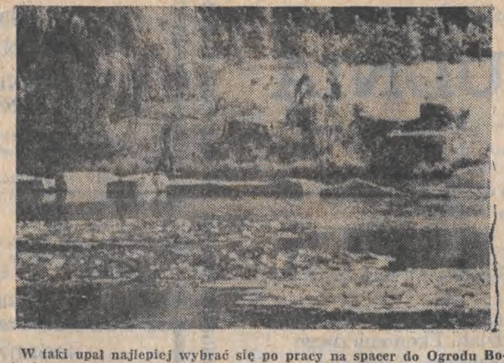
W taki upał najlepiej wybrać się po pracy na spacer do Ogrodu Botanicznego. Fot.: A. WACH

Przychodnia dla Olechowa Jak poinformowano nas w ZOZ Łódź-Widzew, od 22 sierpnia mieszkańcy nowego osiedla Olechów-Janów będą mieć swoją przychodnię. Mieści się ona będzie na parterze bloku przy ul. Dąbrówki 14/16. Na początek nowa przychodnia przyjmować będzie tylko pacjentów przychodni ogólnej oraz pediatrycznej. Być może jeszcze w tym roku otwarty zostanie gabinet stomatologiczny a w przyszłym — ginekologiczny. Na razie mieszkańcy tego osiedla przyjmowane będą w poradni „K” przy ul. Gorkiego 21a. (W. M.)