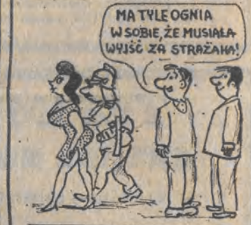
Rys.: A. Bienkowski

Bank Gospodarki Żywnościowej poszukuje: „wożnego (kobietę)”. Gdyby napisać „wożną” byłoby za proste?