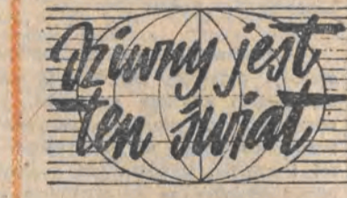
Ożwiwny jest ten świat

Agencja Reutersa podkreśla, że zniesienie stanu wyjątkowego nastąpiło na sześć tygodni przed wyborami prezydenckimi w Chile.