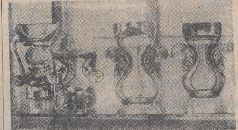
Nz.: szklane cacka z Huty Szkła „Julia” w Szklarskiej Porębie.