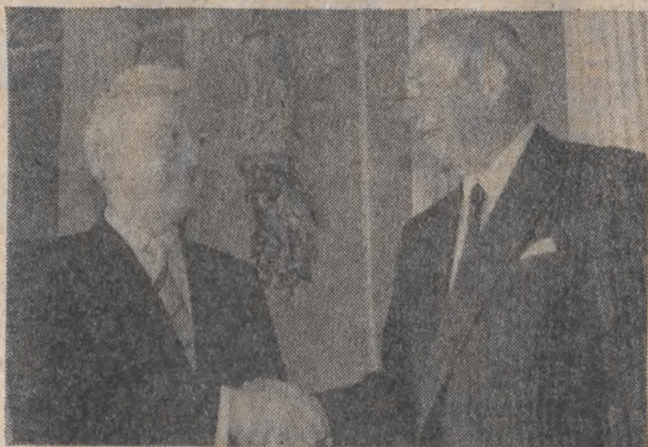
Nz.: E. Szewardnadze z G. Schulzlem.

Przebywający z wizytą w USA radziecki minister spraw zagranicznych Eduard Szewardnadze odwiedził w czwartek rozmowy z amerykańskim sekretarzem stanu Georgem Shultzem.