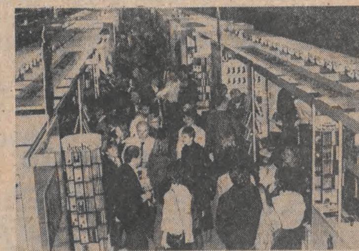
RFN. 5 bm. we Frankfurcie n. Menem otwarte zostały Międzynarodowe Targi Książki, największa impreza tego typu na świecie.

Tu warto przypomnieć, że przed wojną Polska była jednym z nielicznych krajów na świecie, które w tak trudnej dziedzinie jak jest telewizja podjęły własne badania naukowe i eksperymentalne.