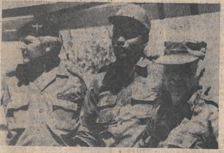
W rejonie przygranicznym między Angolą i Namibią od 27 sierpnia odbywają się regularne spotkania delegacji wojskowych Angoli, Kuby i RPA, podczas których omawiane są sprawy przywrócenia pokoju w tym rejonie Afryki. N.z. od lewej — przedstawiciel RPA, Angoli i Kuby.

Pierwsza była Floryda, a w ślad za nią idzie Nowy Jork. Należy sądzić, że za nimi pójdą inni. Otóż wprowadzono tam obowiązkowa 5-dolarowa kaucja za każdy akumulator samochodowy, niezależnie od tego, czy znajduje się w samochodzie, czy też na wymianie do pojazdu już od jakiegoś czasu używanego. Zdaniem pomysłodawców, chodzi o dwie sprawy. Pierwsza, to ochrona środowiska, gdyż akumulator wyrzucony jest, co często się dzieje, do rzeki, czy innego zbiornika wodnego i zatrują je przez dłuższy czas, a po drugie — o odzyskanie pewnych składników, z jakich zbudowany jest ten aparat.