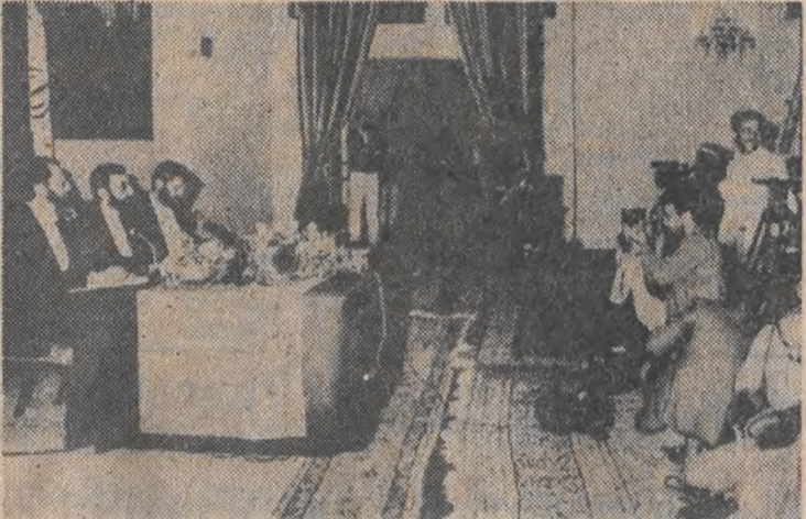
17 bm. na konferencji prasowej w Teheranie minister spraw zagranicznych Iranu Ali Akbar Velayati oświadczył, że zgadza się na formułę zaproponowaną przez ONZ, a dotyczącą układu o pokoju z Irakiem.