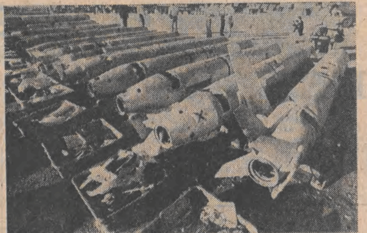
USA. Grupa amerykańskich i radzieckich obserwatorów uczestniczyła w rozpoczęciu 18 bm. demontażu i niszczeniu rakiet Cruise na terenie jednej z baz sił powietrznych USA w stanie Arizona. Zgodnie z układem zniszczonych będzie 14 rakiet Cruise.