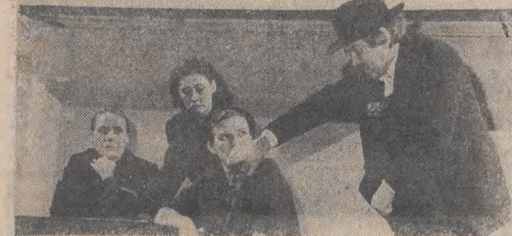
Nz.: scena zbiorowa ze sztuki „Wędrowny teatr Sopalicia”.