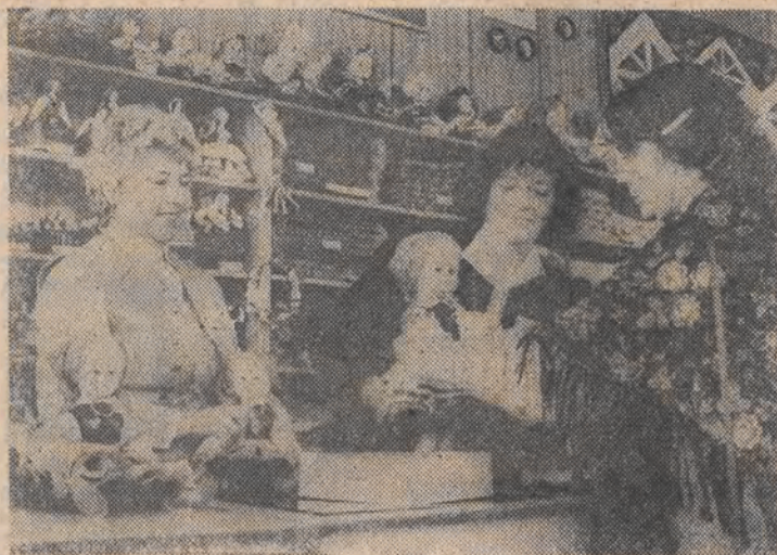
Słoczne lalki w oryginalnych, regionalnych strojach ludowych można oglądać na wystawie przedwiozowej w „Cepelli” przy hotelu „Centrum”. Miniaturowe modelki, ubrane w barwne spodniczki, gorsecki i haftowane bluzki oraz zapaski, prezentują ubiory m. in. z Łowickiego, Piotrkowskiego, Krakowskiego, Śląska i z Beskidu.