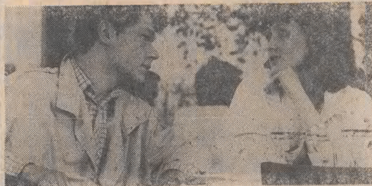
Nz.: scena z filmu „Garaz”.

„Wasze kino nie nadaża za biegiem wydarzeń, radzieckie wyprzedza przebieg procesów społeczno-politycznych”. Takie widzenie współczesności przedstawione przez młodego reżysera — jednego z członków delegacji na otwarcie Dni Filmu Radzieckiego — brzmi oczywiście schematycznie, ale dokumentujące to treści teraz bardzo łatwo podłożyć.