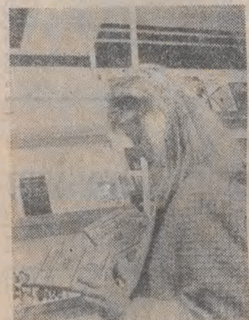
„70 lat niepodległości Polski w książce i dokumencie” pod tym hasłem zainaugurowano centralną dekady „Człowiek — Świat — Polityka”.

Dekada książki społeczno-politycznej zainaugurowana została również w innych województwach. Kiermasze nowości zorganizowały liczne księgarnie „Domu Książki”, które otrzymały z tej okazji wiele świeżo wydanych pozycji. Jedną z nowości „Dekady” jest książka „Inteligencja wobec nowych problemów socjalizmu” stanowiąca zapis z spotkania Michała Gorbaczowa z przedstawicielami polskiej inteligencji i odtwórcami polskiej podażi jego wizyty w naszym kraju na Zamku Królewskim w Warszawie. (PAP)