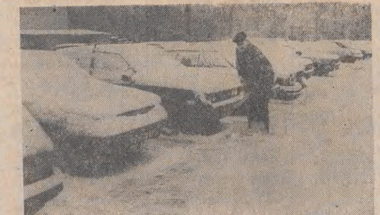
Na zdjęciu: wczoraj po raz pierwszy trzeba się było wiać do odgarniania śniegu...

Z pierwszą w tym roku wziętą (podobno tylko kilkudziesięciu) przybyła do Łodzi zima. Śnieg zaczął padać niedzielną o godz. 23.40 i — jak powiedziała nam miła pani w stacji „meteo” na Lublinku — do 7 rano spadło go 7 cm. W nocy na trasie wyjechało kilkanaście piugiopłaskarek MPO, później do akcji wkroczyły jeszcze 4 z 11 przygotowanych piugów z „Transbudu” (to dobra wola tego przedsiębiorstwa, bo zgodnie z umową piugi mają być do dyspozycji dopiero od 1 grudnia). Mieszkańcy piaszki z sobą posypywaną jezdnią MPK, władzki niebezpieczne zakrety itp. Na ulicach zaś było ślisko, co potwierdził oficer dyżurny „drogówki”, mówiąc, że sporo było drobnych stłuczek i poślizgów (niektóre zakończonych w rowach). Do południa zdarzyło się też 5 kolizji, których uczestnicy doznali obrażeń ciała. Bez swanku wyszło natomiast z pierwszej potyczki z zimą lódzkie MPK. Rano wyjechały na trasę wszystkie „rozkładowe” tramwaje (307) i autobusy (480). Kierowcy tych ostatnich narzekali co prawda na śliskie jezdnie, ale większych kłopotów z tego powodu nie było, podobnie jak w PKS, gdzie