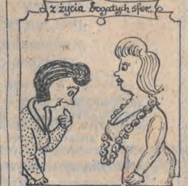
z życia Bogatych Spot... — Ta mała krzyk mędy... — Nazywajnik z suszonych orzechów! Nawet pani Thatcher nie mogła sobie pozwolić na taki luksus, a mnie stała na to!

DE „DZIENNIK ŁÓDZKI” — dziennik Robotniczej Spółdzielni Wydawniczej „Prasa-Książka-Ruch”. Wydawca: Łódzkie Wydawnictwo Prasowe, Łódź, ul. Sienkiewicza 3/5. Druk: Prasowe Zakłady Graficzne w Łodzi. Redaguje kolegium. Redakcja: kod 90-113 Łódź, ul. Sienkiewicza 9. Adres pocztowy: „DE” Łódź, skr. poczt. 89. Telefony: centrala 32-93-00 (łączy z wszystkimi działami) Redaktor naczelny: Henryk Walenda; zastępcy redaktora naczelnego: 32-98-65 i 33-07-26; sekretarz odpowiedzialny I i II sekretarz: 32-04-75. Sprawy miasta: 33-41-10, 33-37-47, społeczno-ekonomiczne: 32-28-32, 33-10-38, 32-89-47, 84-06-15; fotoreporter: 33-78-97; kultura i oświata: 36-21-60; sport: 32-08-95; dział łączności z czytelnikami: 32-98-63; interwencje: 33-03-94; sprawy terenowe: 32-23-03 (rekopisów nie zamówionych redakcja nie zwraca). Redakcja nocna: 74-72-01 i 74-71-30. Ogłoszenia i nekrologi — Biuro Reklam i Ogłoszeń, Łódź, ul. Piotrkowska 96, tel. 36-49-70 i ul. Sienkiewicza 3/5, tel. 32-59-11 (za treść ogłoszeń redakcja nie odpowiada). Warunki prenumeraty podają oddziały APUK RSW „Prasa-Książka-Ruch” oraz odpowiednie urzędy pocztowe.