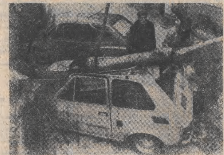
Skutki wtorkowej nawałnicy a przede wszystkim silnej wichury, która łamała, zrywała przewody elektryczne odczuło wielu mieszkańców Warszawy.

IMGW przewiduje w okresie od 2 do 6 grudnia początkowo chłodno, potem nieco cieplej. Spodziewane jest zachmurzenie duże z rozproszonymi i okresowymi opadami początkowo śniegu, potem śniegu z deszczem i deszczu. Nastąpi wzrost temperatury maksymalnej od minus 4 — plus 3 st. do minus 1 — plus 5 st. z możliwością wyżej a minimalnej od minus 10 — minus 3 st. do minus 3 — plus 3 st.