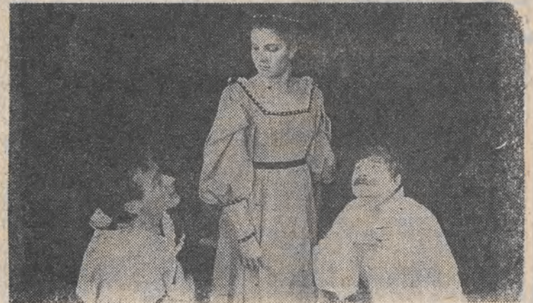
Nz.: Scena z „Romancey” w Teatrze Nowym.

Druga płyta to podwójny album „Lata minęły pieśń pozostała...”, będący największą wydaną do tej pory kolekcją polskich pieśni powstałych na przestrzeni kilkuset lat od „Bogurodzicy” przez „Rotę”, „Marsz Polonia” po „Czerwone maki”, „Marsz Mokotowa”, „Oke” i „Karpacką brygadę”. Wszystkie pieśni w wykonaniu Centralnego Zespołu Artystycznego Wojska Polskiego. (PAP)