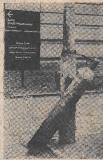
Strzałka na planszy wskazuje kierunek do Salonu Sztuki Współczesnej, ale niektóre eksponaty — jak widać — „wyszły” na ulicę...

W niedzielę, 4 grudnia, o godz. 11 spotkanie w zabytkowej siedzibie ZW PTTK, ul. Wigury 12a. Komisja Opieki nad Zabytkami przedstawi odbudowany obiekt (dawny pałac Etingona) będzie też prelekcja na temat zabytków Łodzi.