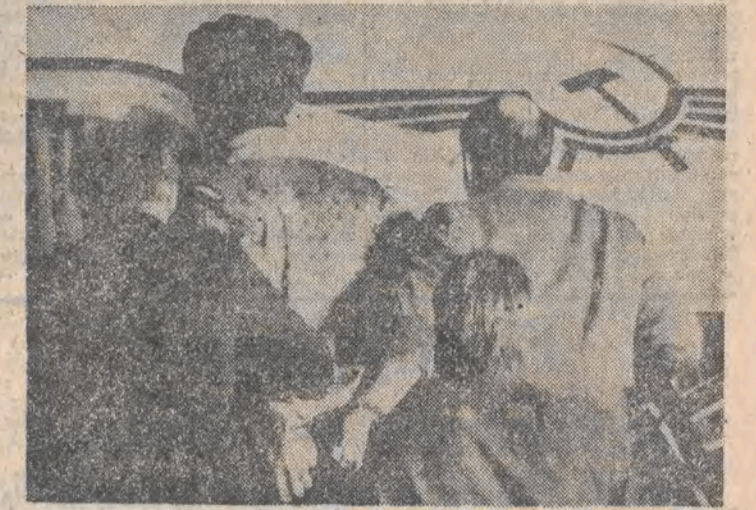
Jeden z 5 porwaczy radzieckiego samolotu, który wylądował 3 km. w Tel-Awiewie prowadzony przez radziecką służbę bezpieczeństwa.

Jak zakomunikowała agencja TASS, w niedzielę wrócił do Moskwy piraci powietrzni, którzy w piątek uprowadzili samolot, przechwytyjąc wcześniej autobus z dziećmi w charakterze zakładników. Udostępnionym im przez władze radzieckie samolotem przestępcy udali się do Izraela w nadziei uzyskania tam bezpiecznego schronienia. Na prośbę władz ZSRR Izrael po zbadaniu wszystkich aspektów sprawy zgodził się na ich zwolnienie. (DALSZY CIĄG NA STR. 2)