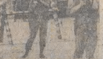
Zbuntowani żołnierze argentyńscy znajdujący się na terenie bazy w pobliżu Buenos Aires strzelają w powietrze, chcąc rozprężyć demonstrującą przeciwko nim ludność cywilną.

W związku z napiętą sytuacją, wojsko wzmocniło ochronę nad Casa Rosada, rezydencją prezydenta kraju. Rebelianci, którzy tymczasem przemieścili swą kwaterę główną do bazy służącej za skład amunicji na obrzeżach Buenos Aires, żądają m. in. zmian w rządzie, ustąpienia naczelnego dowódcy armii i zastąpienia go przez generała wybranego przez siebie, a także umożliwienia im wyboru generałów, pułkowników i podpułkowników w służbie czynnej.