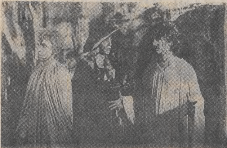
Scena z filmu „Niezwyczajna podróż Baltazara Kobera”.

Do moralnej oceny postaw i zachowań ludzkich odnosi akcję filmu