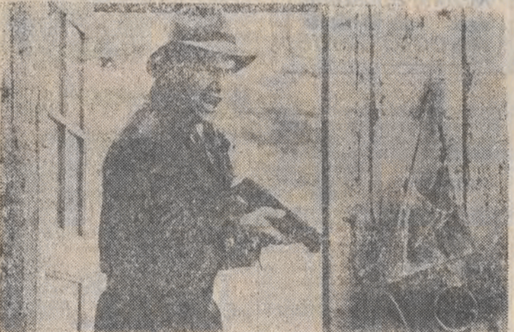
Kadr z filmu „Nietykalni”.