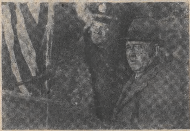
Michaił Gorbaczow przemawia na lotnisku Kennedy'ego w Nowym Jorku.