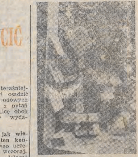
Książka zawsze była dobrym prezentem, nie tylko gwiazdkowym. Jak tu jej nie kupić, gdy zachęca do tego taki Mikołaj?

W Piotrkowie Trybunalskim odbyło się wczoraj uroczyste plenum KW PZPR poświęcone 40 rocznicy zjednoczenia ruchu robotniczego. W czasie obrad w wypowiedziach weteranów i dzisiejszych działaczy tego ruchu historia wielokrotnie przeplatała się z teraźniejszością.