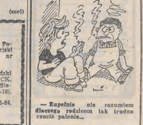
— Zupełnie nie rozumiem dlaczego rodzicom tak trudno rzucić palenie...

W perspektywie serca odległości wydają się straszne.