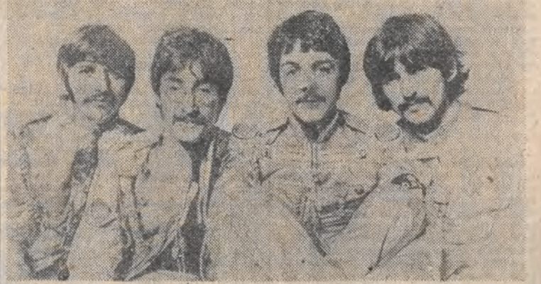
The Beatles w 1967 roku.