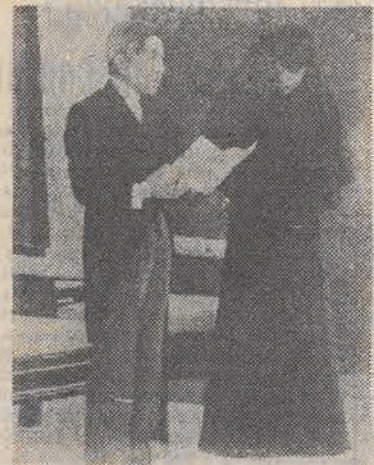
Cesarz Japonii Akihito wziął udział w swojej pierwszej audycji po śmierci ojca — cesarza Hirohito.

9 stycznia rząd nie podejmował decyzji. Obrady nie były oparte o jakikolwiek porządek dzienny, wypełniła je swobodna dyskusja.