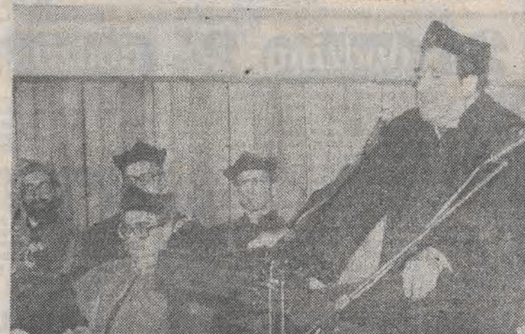
Wczoraj odbyła się w Poznaniu uroczystość nadania tytułu doktora honoris causa Uniwersytetu im. Adama Mickiewicza Robertowi Maxwellowi — znanemu angielskiemu potentatowi prasowemu. Na zdjęciu: Robert Maxwell przemawia po otrzymaniu tytułu.