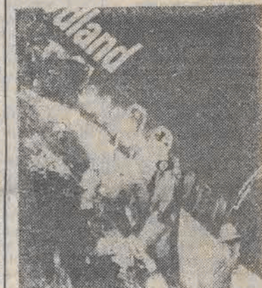
Ratownicy przeszukują wrak samolotu.

jest ostatecznie ustalona — nadal trwa akcja przeszukiwania wraku.