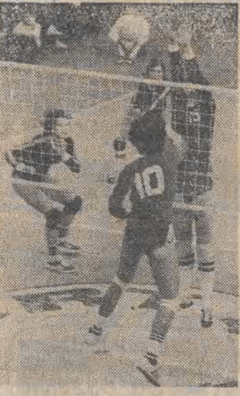
← Wygrana koszykarek Włocławka ← Komplet zwycięstw siatkarek ŁKS ← Wifama pokonała tylko Legię (Szczegóły i pozostałe wiadomości sportowe na str. 6)