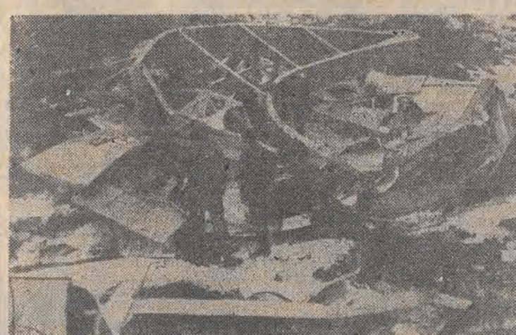
FRANCJA. Ośmiu członków ekipy technicznej zginęło podczas próby kolejki linowej w Alpach d'Huez. Nt.: szczątki rozbitego wagonika.

Szwedzi zainteresowali się szwedzkim pieczywem. Tutajskie zakłady produkcji piekarniczej „Spółem” podpisały kontrakt z handlowcem z Göteborga na próbne dostawy do Szwecji kilku gatunków chleba, sucharków, ciasteczek typu „bez” itp. Jeśli pieczywo zasmakuje Szwedom zawarty zostanie kontrakt na trzy lata. Zarobione w ten sposób korony szwedzkie byłyby przeznaczone na modernizację zakładu.