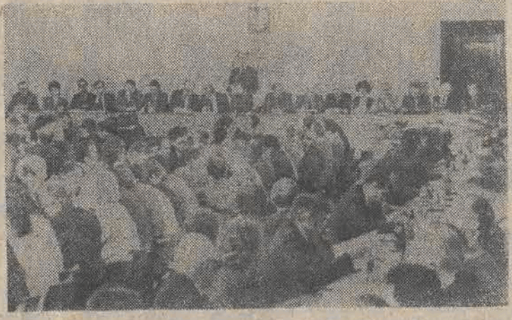
Rozpoczęła się druga część obrad X Plenum KC PZPR. Nz.: obrady otworzył Wojciech Jaruzelski.