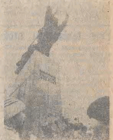
17 bm. z okazji 44 rocznicy wyzwolenia Warszawy pod pomnikiem „Bohaterom Warszawy” — warszawska Nike złożono wiązanek kwiatów.