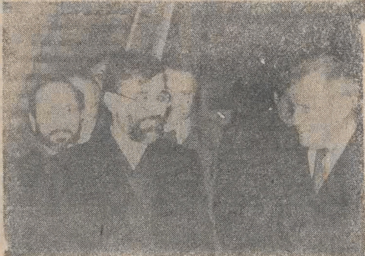
17 bm. na zaproszenie Mieczysława F. Rakowskiego przybył do Polski z wizytą oficjalną premier Islamskiej Republiki Iranu Mir Hossain Musawi.