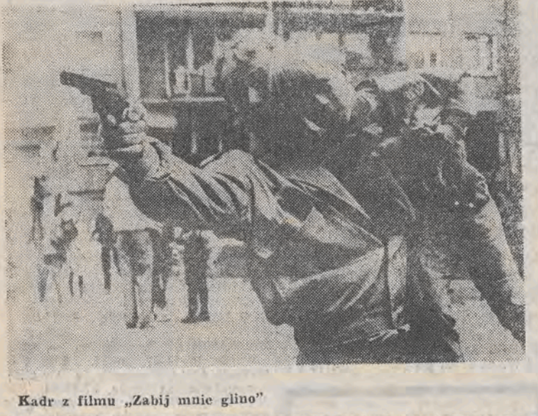
Kadr z filmu „Zabij mnie glino”