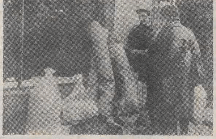
Ciekawe czy jeszcze coś zostało dla innych...?

Ostatnio przed kasami PKO znów zrobiło się gęsto. Dzięki temu, że znacznie zwiększył się skup. I Oddział PKO zdecydował się na sprzedaż bonów banku PKO SA bez ograniczeń. Na ile to wystarczy — zobaczymy w każ- dym razie wiadomo że w innych miastach sprzedaż bonów bez o- graniczeń odbywa się od dawna. Dużą popularnością cieszy się konkurs 50 tysięcy, w którym można wygrać 20 milionów (wpla- cenie 50 tysięcy na sześć miesię- cy) lub 50 milionów (wplata na dziewięć miesięcy). Do tej pory (deklaracje można składać do koń- ca stycznia) w Łodzi do konkur- su zgłosiło się już 34 tysiące osób. Nowością o której poinformował nas również dyr. Szadkowski, jest projekt przywrócenia po kilku la- tach księżeczek na okaziciela.