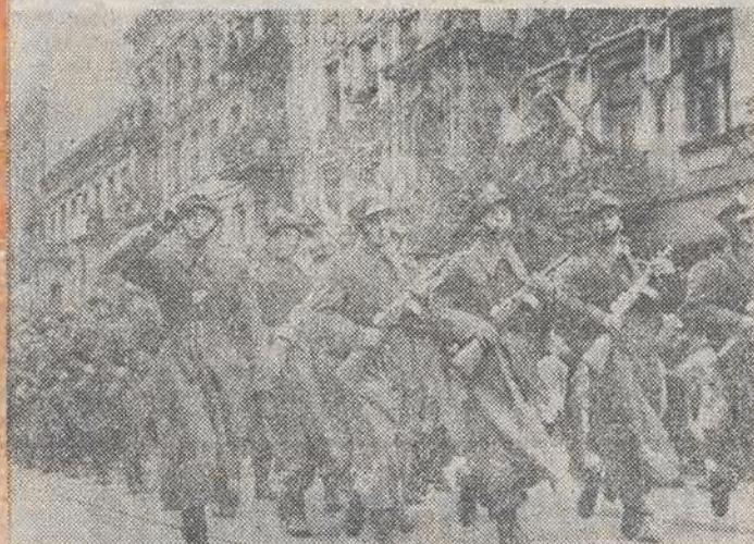
Pierwsza defilada wojskowa w wolnej Łodzi.