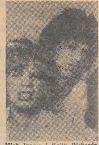
Mick Jagger i Keith Richards.

Nasi fani też cenią sobie ostrzejszą odmianę rocka, o czym świadczy chociażby zestaw utworów na czele listy przebojów pr. III PR. Wprawdzie w ubiegłym tygodniu drugie miejsce zajmował Michael Jackson, jednak tuż za nim znalazł się zespół Def Leppard z utworem „Love Bites”. Natomiast przewodziła w „trójkowym” zestawieniu — zupełnie zastępując —