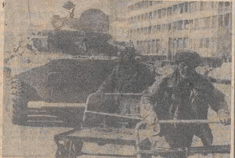
Samochód opancerzony patroluje ulice Kabulu po wycofaniu się wojsk radzieckich z Afganistanu.