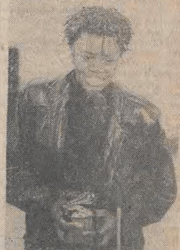
Amerkańska piosenkarka Tracy Chapman z jedną ze swych nagród „Grammy” która otrzymała 22 bm. w Los Angeles.

Dyrekcja Zakładów Fotochemicznych „Foton” w Bydgoszczy przeznaczyła jeden mln zł nagrody za wskazanie lub pomoc w ujawnieniu sprawców kradzieży 750 kg azotanu srebra wartości przeszło 53 mln zł. Jak twierdzą fachowcy, z 750 kg azotanu można otrzymać 500 kg srebra najwyższej próby.