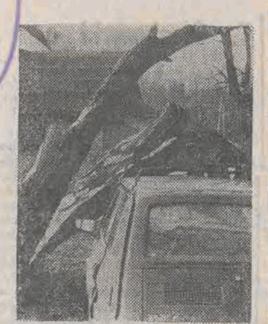
Wielający przez ostatnie dni w Tatrach wiatr halny uszkodził wiele budynków i polamał drzewa.