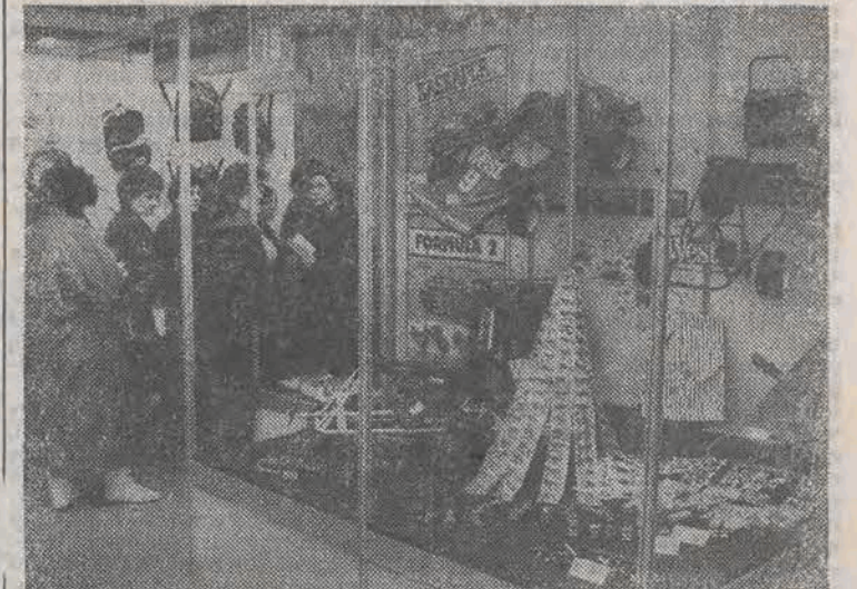
Czy po zrealizowaniu transakcji handlowych dzieci będą zadowolone, a rodzice usatysfakcjonowani? Na razie odpowiedź na to pytanie nie znają tylko ci, którzy bywają służbowo na międzynarodowych targach zabawek w Norymberdze oraz najstarsi pracownicy najstarsze w Polsce spółdzielni zabawekarskiej - Kieleckiej „Gromady” (założonej w marcu 1939 roku). Dlaczego akurat oni? Dlatego, że mają możliwość porównania czym bawią się dzieci w innych krajach oraz - jak to drzewie było. Jeśli jesienią tego roku dojdzie do otwarcia w Łodzi pierwszych międzynarodowych targów zabawek (DALSZY CIĄG NA STR. 3)