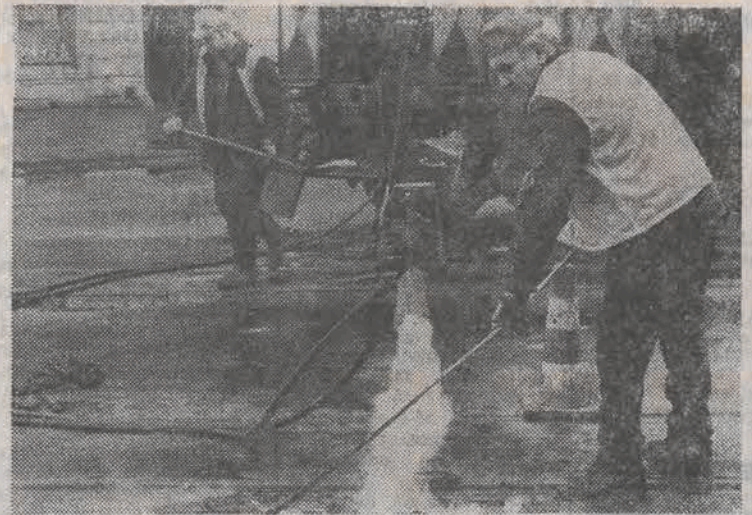
Tegoroczna zima była łaskawa dla drogowców. Mimo to stan nawierzchni ulic Łodzi nie jest najlepszy. Drogowcy, korzystając z wiosennej pogody, usuwają uszkodzenia. (Wach)