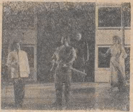
Warszawska tetralogia to nade wszystko