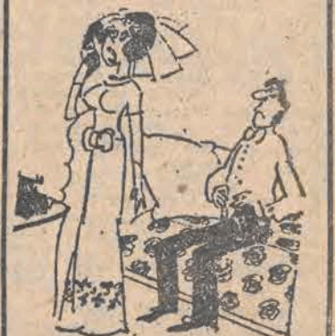
— Mamusiu, chodź, ja się boję!

Ta wojna wybuchła 1 września i zaczęła się na skutek zmywu naszych sąsiadów. Wszystkie inne koncepcje są fikcją i obudą. 1 września 1939 r. musi pozostać datą oznaczającą początek 5-letniej światowej tragedii, chociaż dla Zachodu wojna — po krótkim wahaniu — zaczęła się w trzy dni później, ale i oni honorują 1 września.