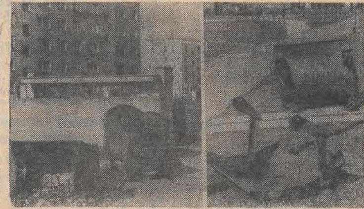
Te zdjęcia wykonano na osiedlu Zagajnikowa przy ul. Niemojewskiego. Widok taki na pewno nie przynosi chłuby administracji osiedla, zwłaszcza że za kilka dni święta, które skłaniają wszystkich do porządków. (Waeh)

Jak płacą zagraniczne firmy swoim pracownikom? W minionym roku średnia płaca wynosiła tam 72 tys. zł, podczas gdy w łódzkiej przemyśle — 52.893 zł. Różnica jest... (ab)