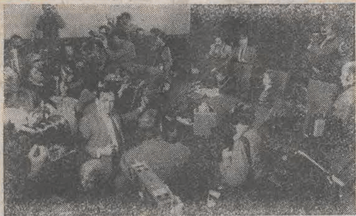
Nz.: moment rejestracji związku.

Sąd Wojewódzki w Warszawie wydał na posiedzeniu 17 bm. postanowienie o wpisaniu do rejestru związków zawodowych — Niezależnego Samorządnego Związku Zawodowego „Solidarność”, jako organizacji o charakterze ogólnokrajowym z siedzibą w Gdańsku.